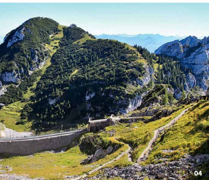
03 Comodo accesso alle barche del lago Chiemsee. 04 Con la ferrovia a cremagliera del Wendelstein si sale comodamente a 1.724 metri.