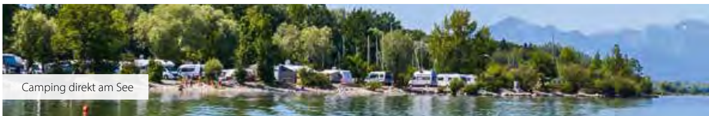
Camping direkt am See

Pauschalgebühr für 24 Stunden. Für Strom- und Wasseranschlüsse ist eine Gebühr zu entrichten, die Entsorgung der Campingtoilette ist kostenfrei. Keine Stellplatzreservierung im Vorfeld möglich.