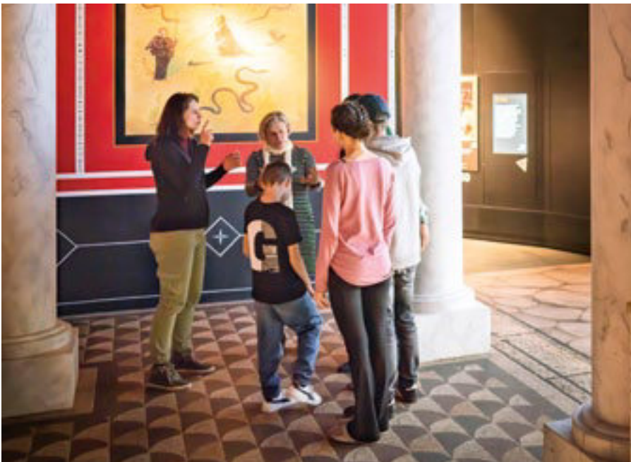
Führung in Gebärdensprache im Lokschuppen Rosenheim