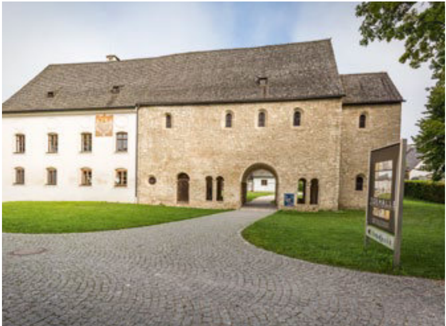
Karolingische Torhalle auf der Fraueninsel