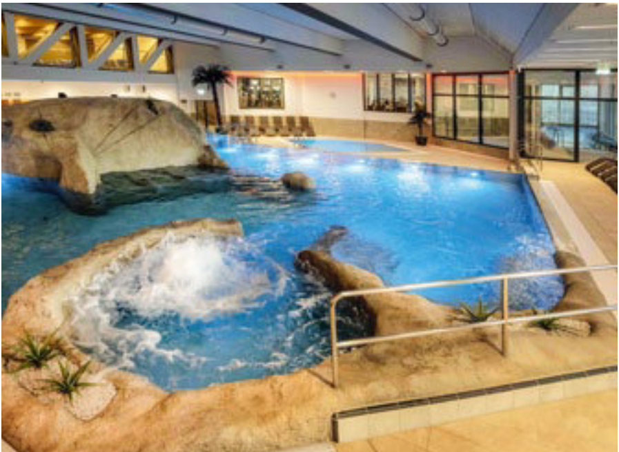
Chiemgau Thermen Bad Endorf