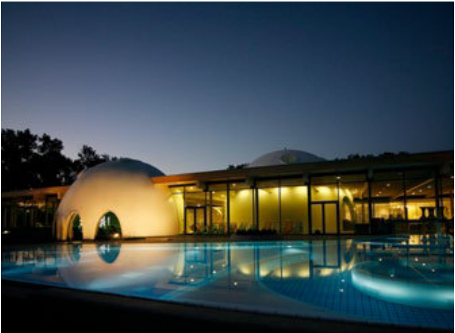
Therme Bad Aibling