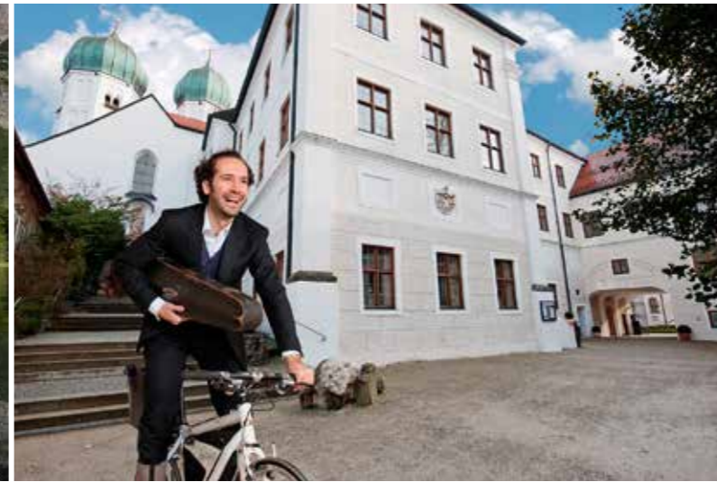
Auf Mozarts Spuren durch großartige Seenlandschaften, vorbei an Kirchen und Klöstern: Blick auf den Chiemsee · Wasserburg am Inn · Wallfahrtskirche Maria Plain · Königssee mit St. Bartholomä · Konzerte und Events im Kloster Seon

Der Mozart-Radweg führt auf insgesamt 450 Kilometern durch die atemberaubende Landschaft des Salzburger Landes, Bayerns und Tirols.