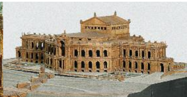
Modell für ein Richard-Wagner-Festspieltheater auf dem Isarhochufer in München, geplant 1864–1866, Ludwig II.-Museum

Bühnenbildmodelle ausgestellt. Die »Königsschlösser« Neuschwanstein, Linderhof und Herrenchiemsee sind ebenso dokumentiert wie die anderen Bauprojekte Ludwigs II. Originale Prunkmöbel aus dem zerstörten königlichen Appartement der Münchener Residenz oder aus dem ersten Schlafzimmer von Schloss Linderhof sind Höhepunkte des Museums. Schau- und Prunkstücke des Kunsthandwerks, vom König in Auftrag gegeben, dokumentieren den europäischen Rang der Münchener Kunst in der zweiten Hälfte des 19. Jahrhunderts.