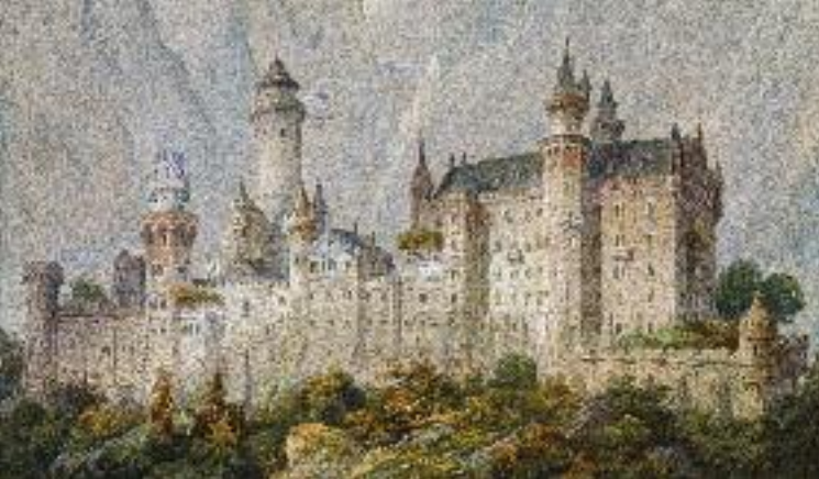
Nicht ausgeführter Idealentwurf für Schloss Neuschwanstein, 1869 von dem Theatermaler Christian Jank geschaffen; Ludwig II.-Museum (WAF München)

Bühnenbildmodelle ausgestellt. Die »Königsschlösser« Neuschwanstein, Linderhof und Herrenchiemsee sind ebenso dokumentiert wie die anderen Bauprojekte Ludwigs II. Originale Prunkmöbel aus dem zerstörten königlichen Appartement der Münchener Residenz oder aus dem ersten Schlafzimmer von Schloss Linderhof sind Höhepunkte des Museums. Schau- und Prunkstücke des Kunsthandwerks, vom König in Auftrag gegeben, dokumentieren den europäischen Rang der Münchener Kunst in der zweiten Hälfte des 19. Jahrhunderts.